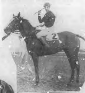
JOCKEY AND HORSE