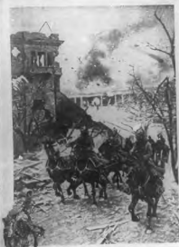
Un momento del combate desarrollado en Boston. Los soldados Rusa de noche en el frente de batalla.

Después de las cinco de la tarde un viento frío del Este vino en compañía de las tropas combatiendo. Norte Americanos y la flota Rusa se movió hacia el norte sobre el frente. Frente un