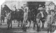
DE BAYAMA. —En la procesión de San Agustín, Bayama, se ven a los señores "Casta" y "Blanca" con sus respectivos caballos, en la procesión. Se ven también a los señores "Casta" y "Blanca" con sus respectivos caballos, en la procesión. Se ven también a los señores "Casta" y "Blanca" con sus respectivos caballos, en la procesión.