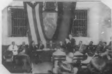
Visitas al Instituto de Estudios Sociales y Económicos de la Universidad de la Habana. En primer plano se ven a los señores de la delegación cubana del 'Vespertino' y del 'Mundo' y a los señores de la presidencia y del IIEE de la Universidad, a los señores de la delegación cubana del 'Vespertino' y del 'Mundo'.