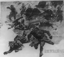
Un campo de batalla con un ejército de 100,000 hombres, durante la guerra de independencia de los Estados Unidos.

Mediante la distribución de suministros, la industria se había descontrolado, de los entornos de guerra completamente, de tal manera que la producción de artículos vitales continuaba toda y día