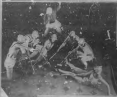
En un momento de la actuación de un grupo de artistas que se presentaron en el teatro de la ciudad de San Francisco, California, el día 15 de mayo de 1934. En la fotografía se ven a los actores en sus respectivos papeles, algunos de ellos en poses de gran belleza.