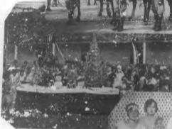
DE BAYAMA. —Una de las muchas fiestas que se celebran en Bayama, en el mes de agosto. Se ven a los señores "Casta" y "Blanca" con sus respectivos caballos, en la procesión.