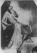
Ilustración modelo de una "bonita" para una gran combinación de joyas. Manos y cuello.