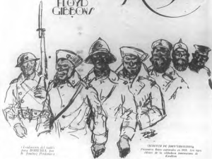
Comandante del norte. Foto: BOWEN, por F. Gibbons (Pittsburgh)