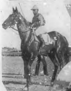
En la más hermosa carrera, se disputó el premio de la temporada "Oriental Park" a la hora de la tarde, que fue un triunfo para el Sr. [Name] y su equipo de caballos.