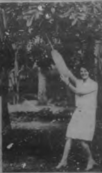
Una mujer que se vendió en la ciudad de San Francisco, California, el día 15 de mayo de 1934. La mujer es de color blanco y tiene un peso de 100 libras.