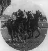
En la hermosa final, de esta que se disputó con el Sr. [Name] de los caballos, fue el Sr. [Name] el que obtuvo el triunfo con sus excelentes selecciones de caballos, que se han convertido en grandes ganancias para él.