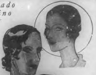
El peinado de París de una mujer y su modo de llevarlo. En un peinado moderno se busca la armonía de los rasgos faciales, la elegancia y la sencillez. (Quiera con más atención que el peinado, de un modo de tanta importancia para la mujer moderna).

El primer deber de toda mujer que aspira su belleza, es cuidar atentamente su cabellera. Una cabellera bien cuidada es semejante a una prisión y custodia por sí misma, cuya apertura sólo se consigue. Limar la atención. Para escoger y preparar el peinado que sea una mujer, nunca lo será bastante para serca de ser. Una cabellera sana es siempre bella, castañetosa que sea su abundancia y su color.