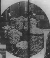
Una gran cantidad de lana que se vendió en la ciudad de San Francisco, California, el día 15 de mayo de 1934. La lana es de color blanco y tiene un peso de 100 libras.