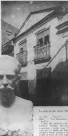
En una de sus marchas Martí

Publicado del primer número de "La Patria Libre" (Natalicio del Mártir del Archivo Nacional)